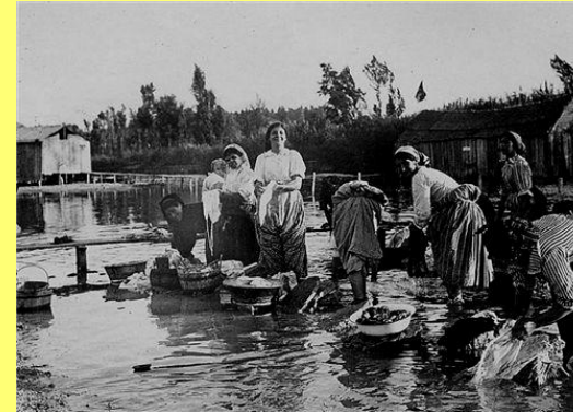
_____ no rio