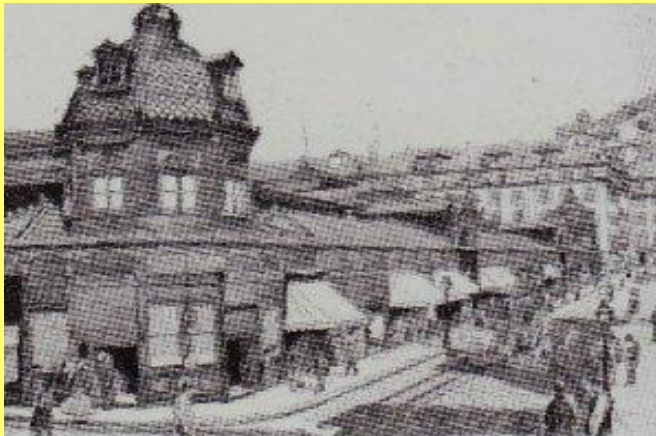
Mercado da _____