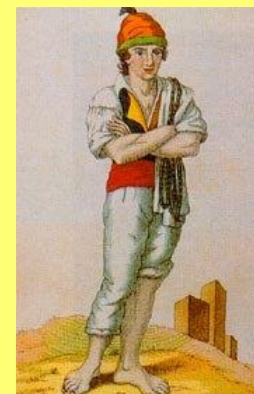
_____ de fretes