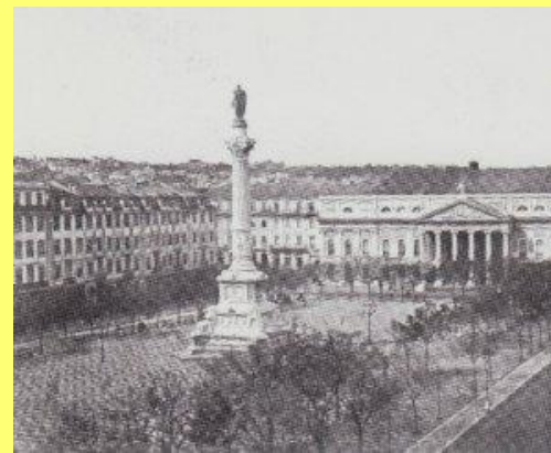
Praça do Rossio ou _____