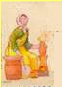
Vendedeira de _____ assadas