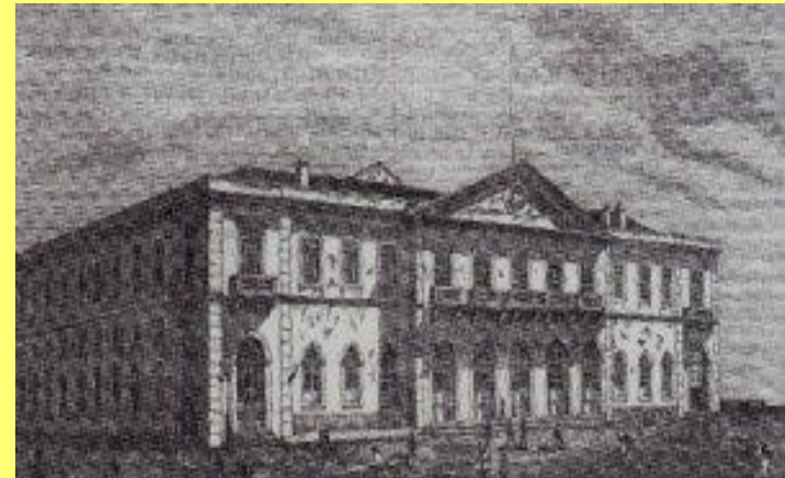
_____ de Santa Apolónia