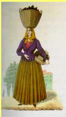
_____ de fruta