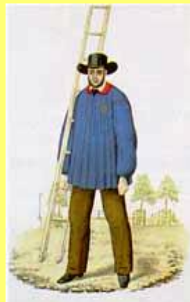
Servente do _____