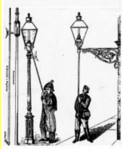
_____ de candeeiros de rua