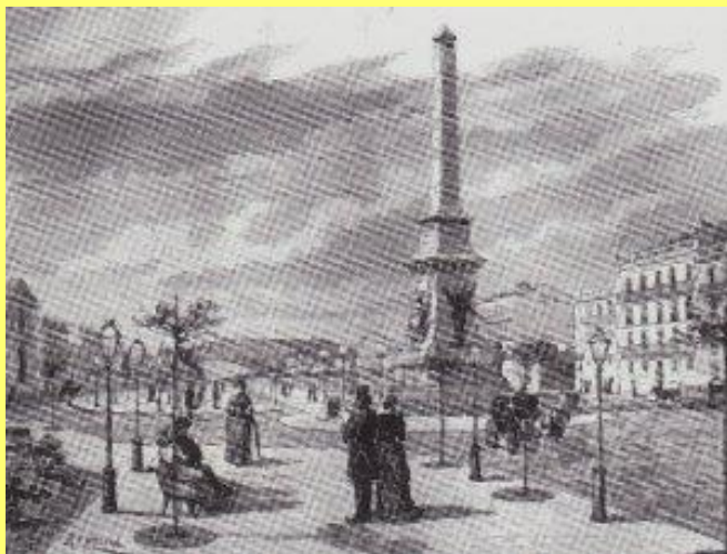
_____ dos Restauradores