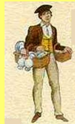
Vendedor de _____