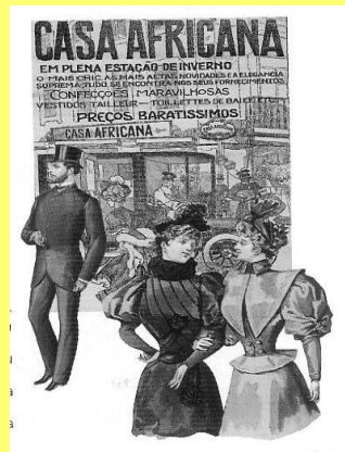
Lojas de _____