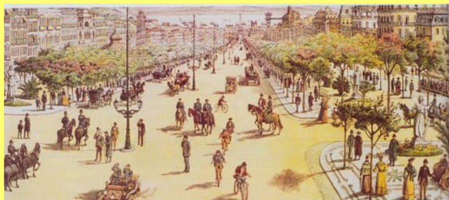
, Avenida da _____ e Passeio _____