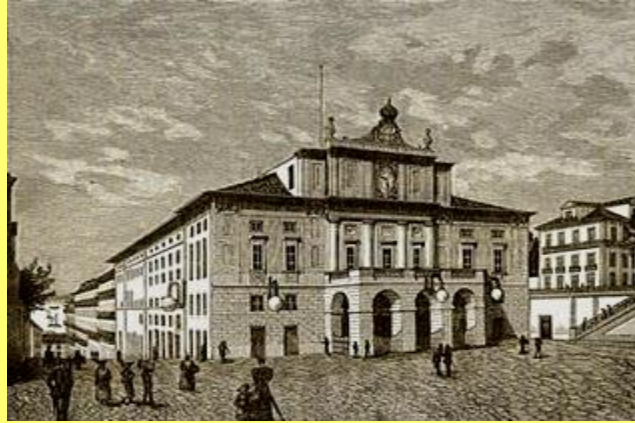
_____ D. Carlos